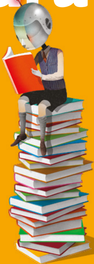
illustrazione © di Brett Ryder