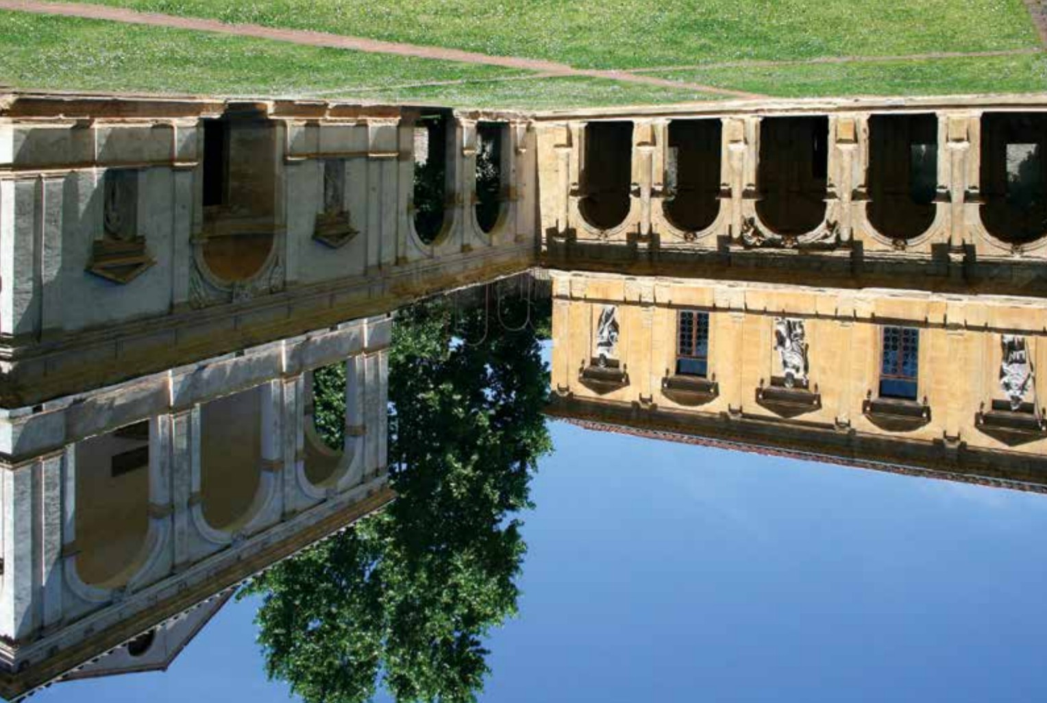
Alvise Cornaro, Compendio della vita sobria , 1561

“...queste mie belle, & comode stanze, fabricate da me con tanti apparati, giardini, che à redurti alla loro perfettione, vi ha bisognato gran tempo...”