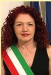
ORNELLA LEONARDI SINDACO

«Ci sono più tesori in un libro che in tutti i covi dei pirati dell'Isola del Tesoro... e meglio di ogni altra cosa, puoi goderti queste ricchezze ogni giorno della tua vita.»